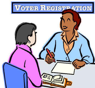
IMAGEN: Una persona registrándose para votar ante otra persona sentada.