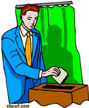
IMAGEN: Un varón depositando su balota en una caja..

Al llegar al sitio de votación tendrás que mostrar identificación confirmando que eres quien dices ser. El tipo de información necesaria cambia en cada estado. Comunícate con el County Clerk o la oficina del Secretary of State del estado para informarte sobre los requisitos de identificación.