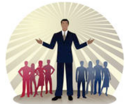
IMAGEN: Un candidato con manos abiertas ante un grupo de personas.

La mayoría de estados envían estas guías a cada hogar. Quizas tendrás que pedirla en formato accesible a la oficina del “Secretary of State” de tu estado. Muchas organizaciones particulares proporcionan información local y nacional. También los diarios suelen publicar información sobre los asuntos y los candidatos poco antes de las elecciones. Reconoce que a pesar de ser fuentes informativas, quizas no sean neutrales.