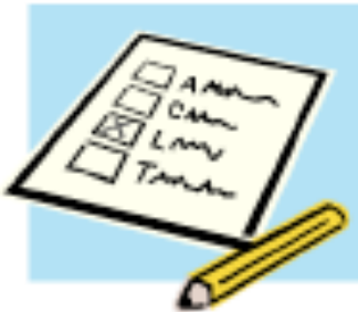
IMAGEN: Una balota de papel como la que se usa para votar ausente.

También puedes votar por correo o balota de ausencia. Algunos estados solo usan la votación de balota por correo. Si no es así en tu estado, puedes solicitar por escrito una balota de ausencia o balota por correo. Hay que hacerlo con muchas semanas de anticipo.