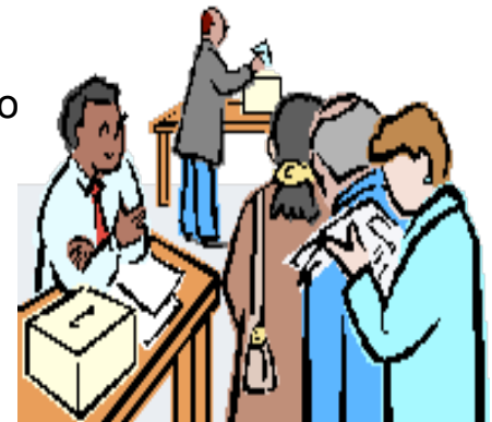
IMAGEN: Personas en las urnas poniendo sus balotas en una caja.

Puedes conseguir ayuda para completar la balota de ausencia o por correo. Muchos estados requieren la firma o nombre en letra molde de la persona que te ayuda. Si pides una balota de ausencia o por correo y luego cambias de parecer, muchos estados no te permitirán votar el día de las elecciones. Si estudias fuera del estado, consigue una balota de ausencia para poder votar. Conoce las reglas y fechas topes de tu estado.